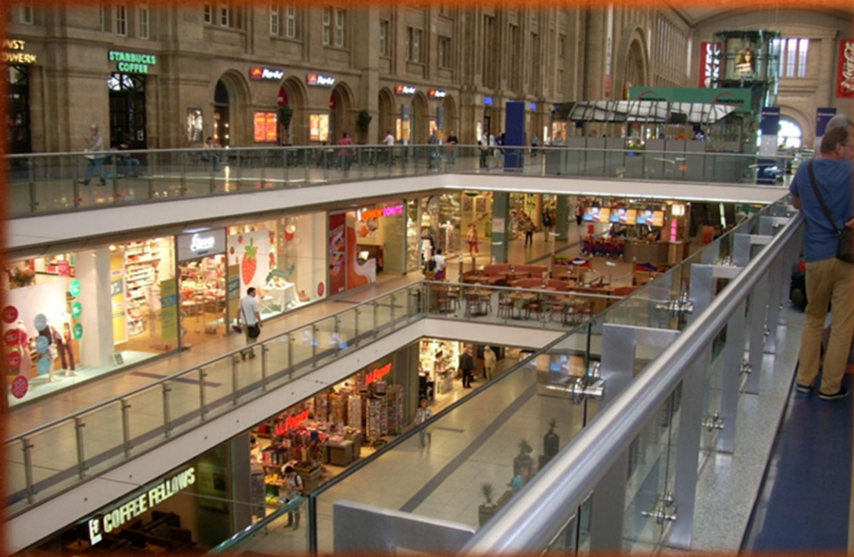
Centra handlowe na Dworcu Głównym